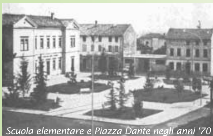
Scuola elementare e Piazza Dante negli anni '70

Una dì i sei lada tal Taiament e cjaminant tai sterps e sui claps i sei rivada tal simiteri das nestras cjasas. A nol jera nissun a fâmi compagnia, noma las maserias: madons a tocs, malta, telârs di balcon, trâfs crevâts e sbrendui di peçots. Cjalant chei rudinaçs i ai pensât ai nestris nonos, che a son migrâts e a àn sudât e scombatût par tirâ sù una puara cjasa, che cumò il teremot al à sdrumât jù.